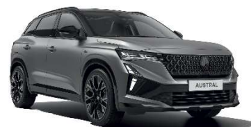
mat siva schiste s biserno crnim krovom (3)