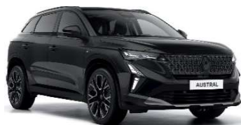
biserno crna (2)