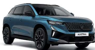
plava Naxos (3)