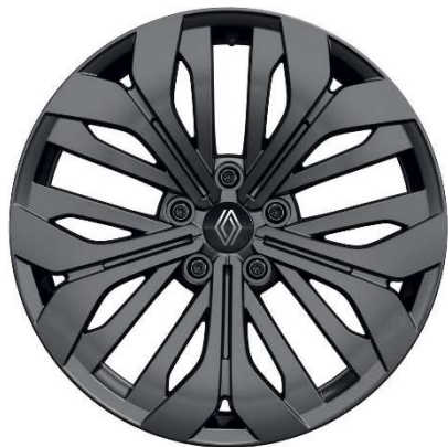
18" alu naplatci Altao