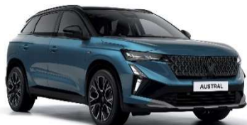
plava Naxos s biserno crnim krovom (2)