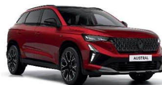
crvena flamme (3)