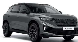
siva schiste s biserno crnim krovom (2)