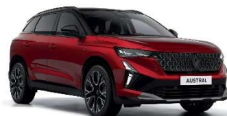
crvena flamme s biserno crnim krovom (3)