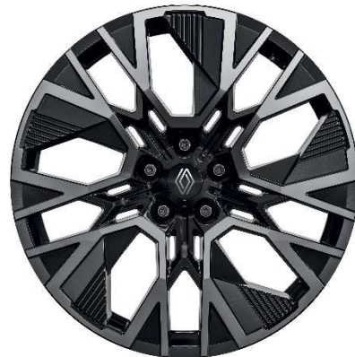
20" alu naplatci Altitude