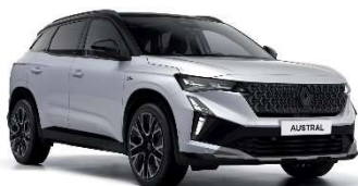
perla bijela s biserno crnim krovom (3)