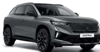
siva schiste (2)