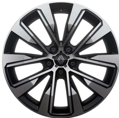
19" alu naplatci Komah