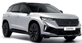
mat bijela s biserno crnim krovom (3)