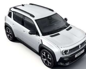
perla bijela (1)