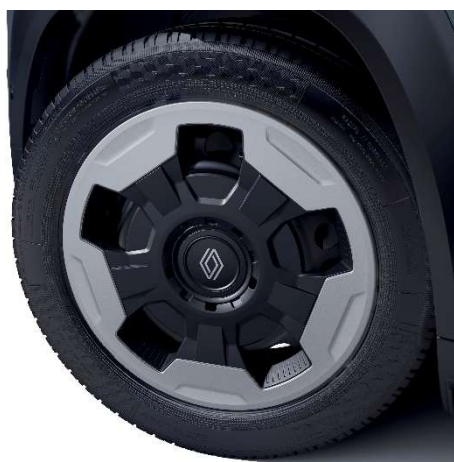
ukrasni pokrovi kotača 18" Jogging