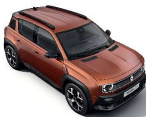
terracotta smeđa (2)