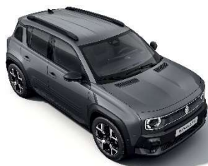
urban siva (1)