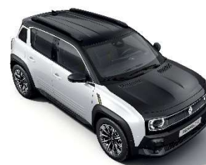
krov i poklopac motora v crni (3)