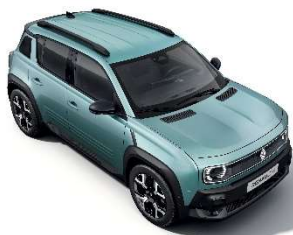
Hauts-de-France zelena (2)