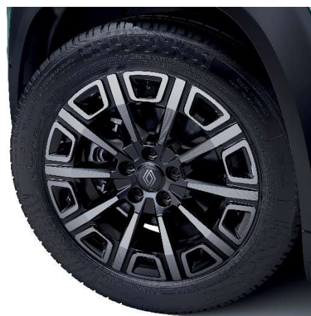
alumijski naplatci 18" Parisienne