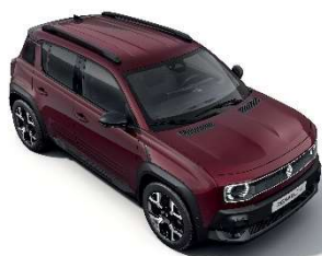
carmin crvena (2)