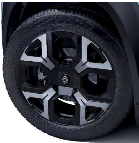
alumijski naplatci 18" Sixties