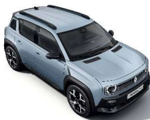
cloud plava (1)