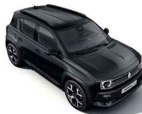
biserno crna (2)