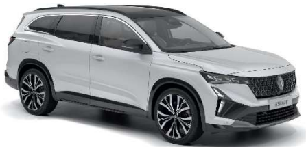
perla bijela (2)