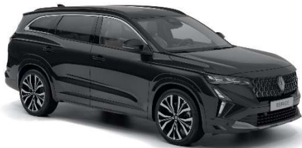
biserno crna (1)