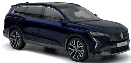
plava nocturne (2)