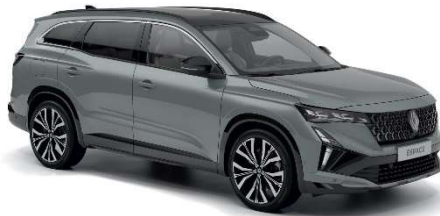
siva baltique (1)