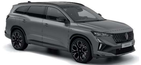
mat siva schiste (3)