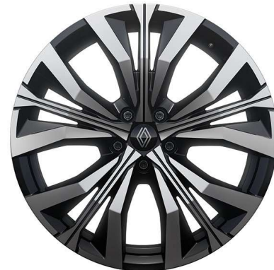
20" alu naplatci Effie